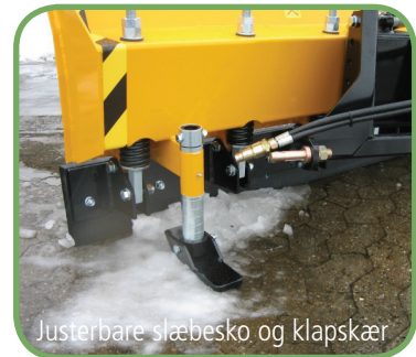
Justerbare slæbesko og klapskær